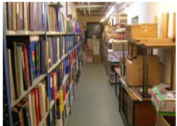
Glimt af biblioteket, gangen er ca. 15 meter