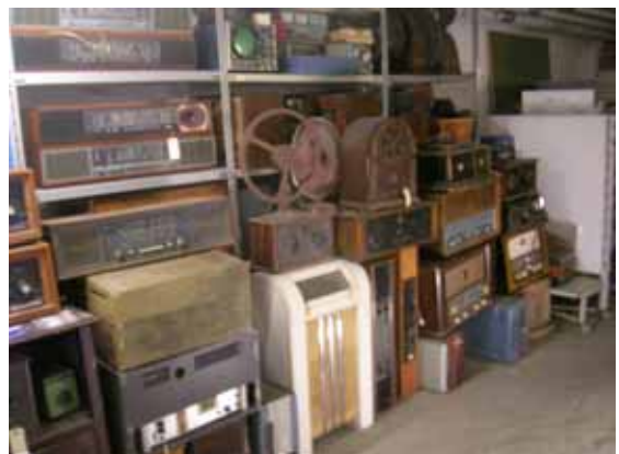
Glimt af nogle af de mange auktionsapparater

Vi har lovet EUC-Ringsted ikke at øge samlingen i kælderen. Vi har nu nået Brandvæsenets grænse. Derfor har vi gennem længere tid udtaget dubletter og apparater, som vi ikke vil gemme længere. Det fylder efterhånden en del og sammen med mange apparater fra "Amager"-samlingen forventer vi, at der vil være mere end 100 apparater, med en rimelig værdi. Indtil videre er apparaterne opbevaret på ekstra hylder i kælderen, samt på "fjernlageret", Sandby Gl. Præstegård.