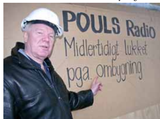
Formanden siger at vi nok skal være klar til tiden