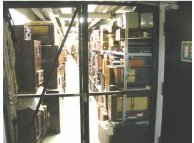
Her skal etableres en branddør og -væg

NB: Vi skal naturligvis selv betale for udgifterne ved etableringen af dørene, som er lovet udført medio 2010. Vi sørger for at få udført arbejdet så hurtigt som muligt og er meget glade for, at vi har den store samling i kælderen.