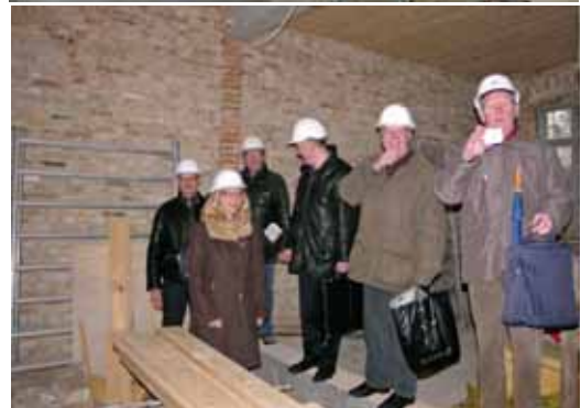
Pouls Radio er ikke helt "klar" til indflytning endnu