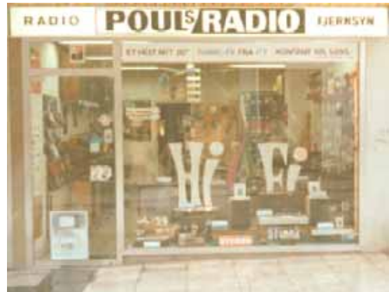
Pouls Radio i Holstebro i 1974 vor "inspirationsmodel"

Disse vil vi kunne anvende til større ting som: Færdige byggesæt og større komponenter som løse højttalere og nettransformatorer m.v. evt. antennemateriel og kabler.