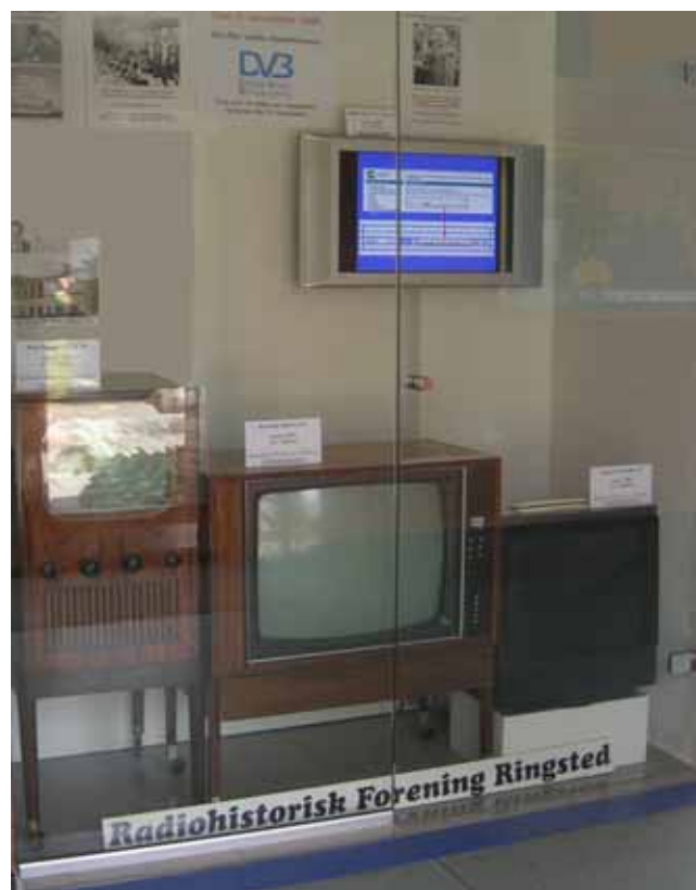
Den nye fine glasmontre på EUC Ringsted hovedgangen