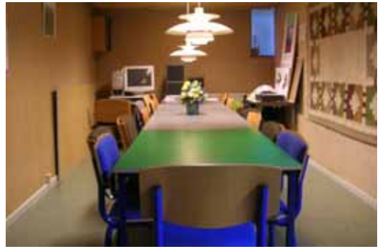
Mødelokalet ligger ved siden af RFR-samlingen

EUC Ringsted har givet os lov til at bruge et fint mødelokale i kælderen. Der er plads til 17 personer omkring bordet. Der er desuden et lille anretterkøkken, køleskab og store vægskabe. Deltagerne sponsorerer selv, så der altid er: Kaffe/the, kage, øl/vand til vores medlemsmøder. Der er plads til mange "røverhistorier" mandag aften'er. Den del af lokalet som vi anvender, er ca. 25 m 2 .