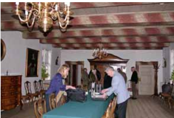
Glimt før vores møde i Møllesalen, et herligt rum